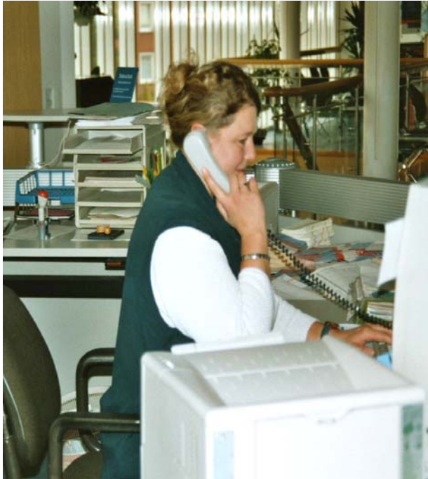
Fachangestellte für Arbeitsförderung bei der Telefonauskunft